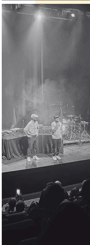
Le duo Faux Soleil après sa performance de sortie de résidence