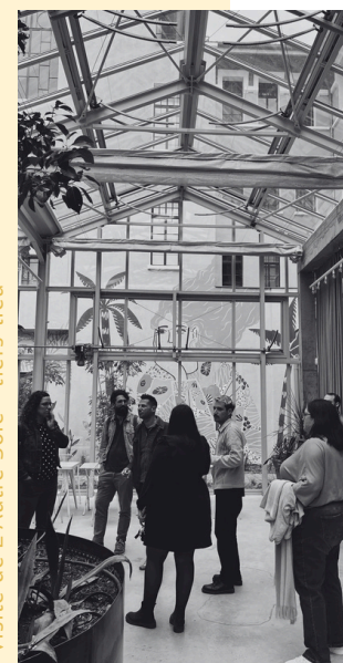
Visite de L'Autre Soie - tiers-lieu