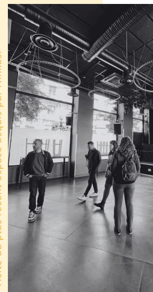
Visite du plus récent espace acquis par Ninkasi