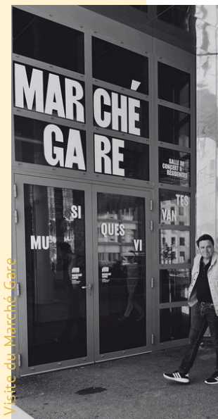
Visite du Marché Gare

Échanges sur la programmation vs. l'actualité nationale/internationale et le travail de rétention des publics éloignés (immigrations, revenus limités, ...).